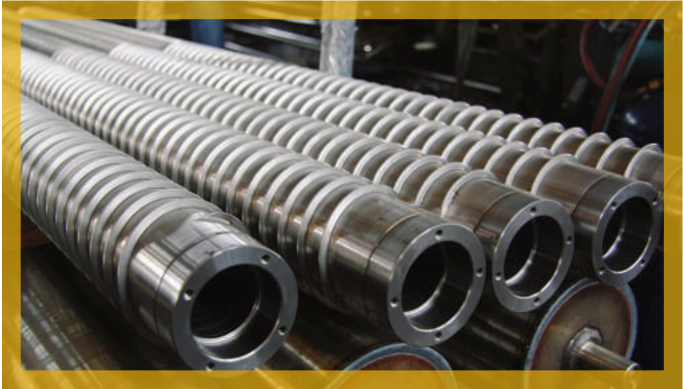
Rulli spiraliati; sotto: la sede aziendale

distinguersi sul mercato e di fornire più servizi ai clienti. L'azienda ha inoltre ampliato il proprio capannone per far spazio ad un piccolo magazzino. Questa gestione logistica ci consente di evadere ordini senza aspettare i materiali dal fornitore e garantire la puntualità delle consegne. Di media, infatti, garantiamo ordini evasi nell'arco di poche settimane». Il loro processo di lavorazione da qualche anno strizza l'occhio anche ai dettami dell'industria 4.0: «Abbiamo