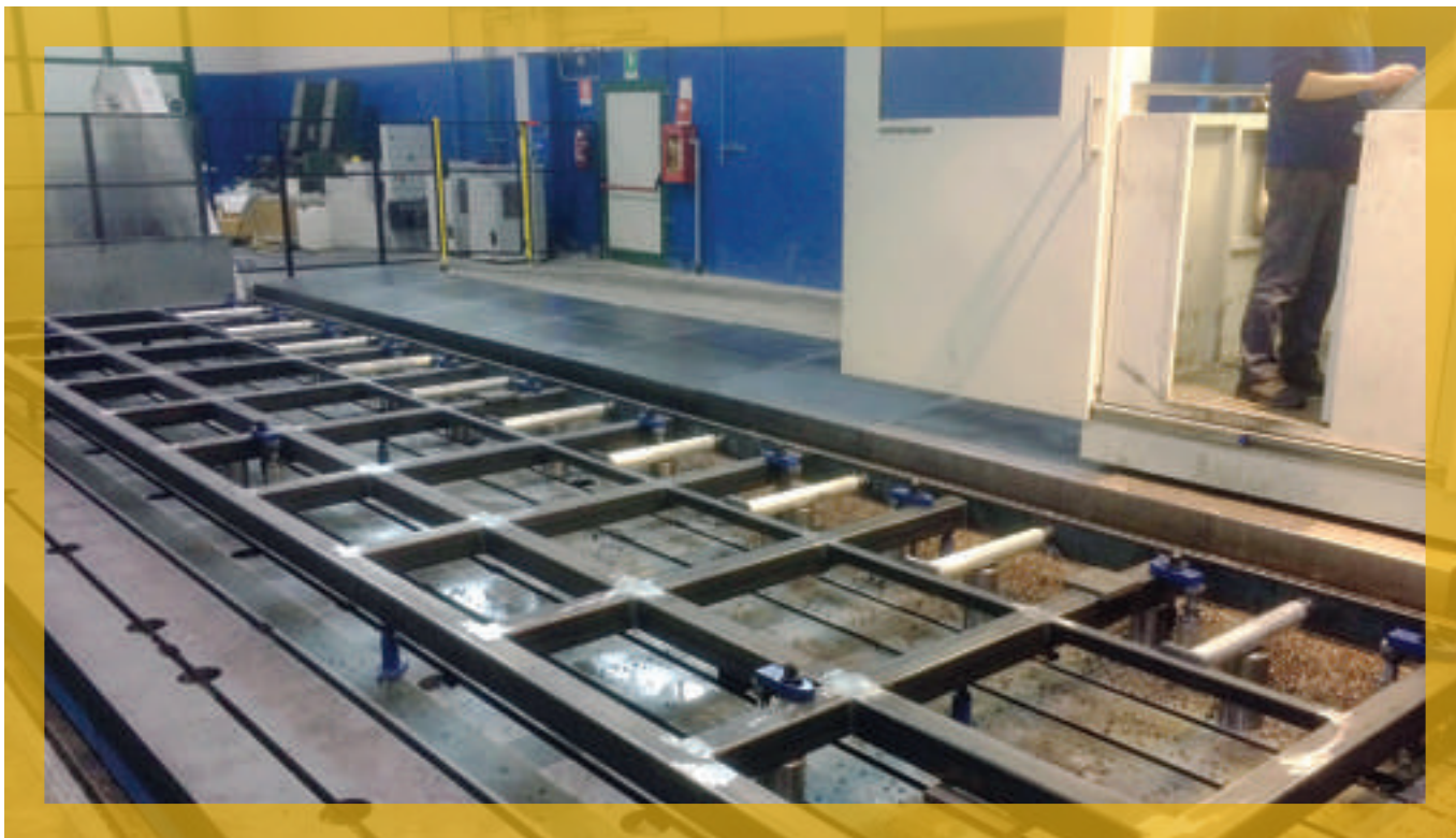
Basamento lunghezza 12 metri in lavorazione su centro di fresatura a montante mobile; sotto cilindro godronato